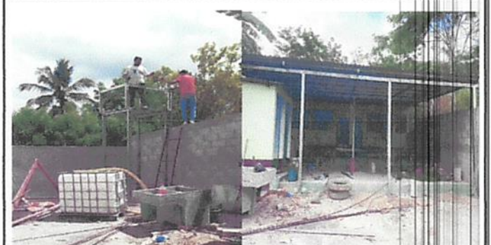
Foto 4: Instalacion de estructura metalica y deposito de agua con sus accesorios, así mismo la galera en el patio con su respectiva estructura metalica y lamina troquelada.