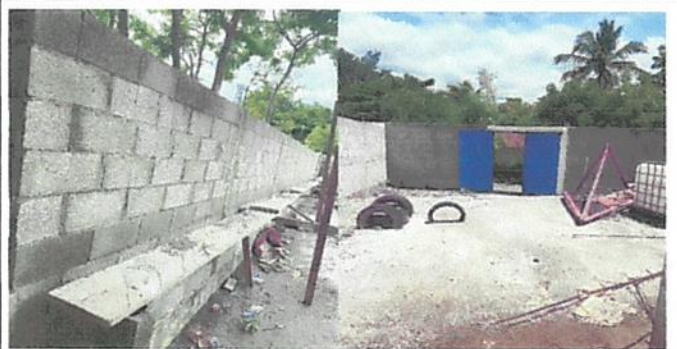
Foto 3: Construccion de muro perimetral e instalacion de porton con su respectiva chapa Yale, así mismo el repello y cernido del interior y exterior de la pared de enfrente.