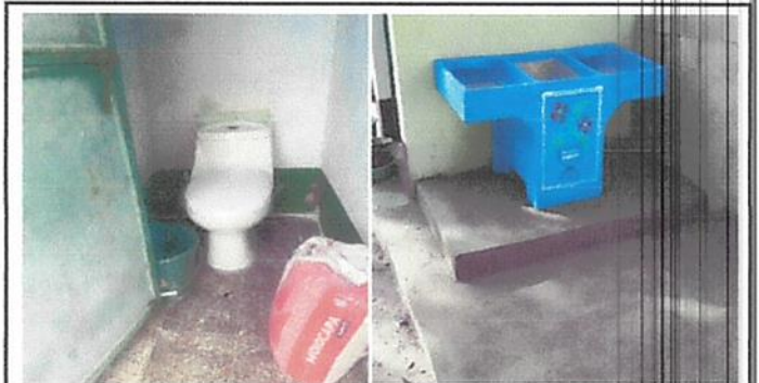
Foto 6: Mantenimiento a dos sanitarios con sus respectivos accesorios e instalacion de una pila de dos lavaderos.

Observación: Si es necesario se pueden agregar hojas adicionales y actualizar el número de hojas.