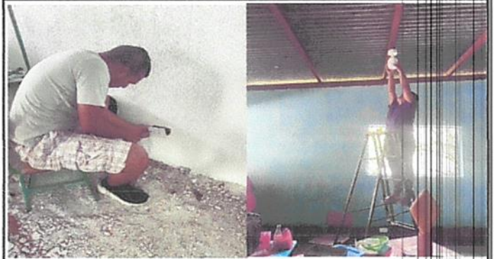
Foto 2: Instalacion de plafoneras, bombillas y toma corrientes en la escuela.